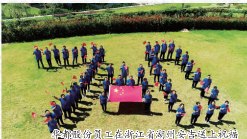
华都股份员工在浙江省湖州安吉送上祝福