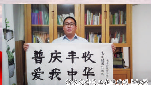
普庆丰收 爱我中华 浙农金泰员工在陕西送上祝福