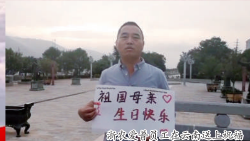
浙农金泰员工在云南送上祝福