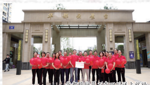
华都股份员工在四川送上祝福