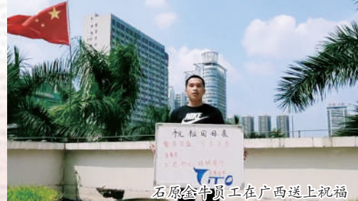
石原金牛员工在广西送上祝福