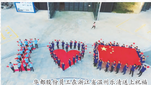
华都股份员工在浙江省乐清市送上祝福