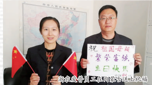
浙农金泰员工在内蒙古送上祝福