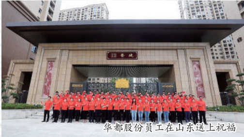
华都股份员工在山东送上祝福