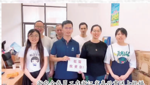
浙农金泰员工在浙江嘉兴送上祝福