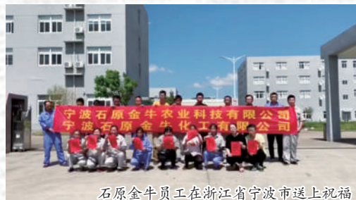
石原金牛员工在浙江省宁波市送上祝福