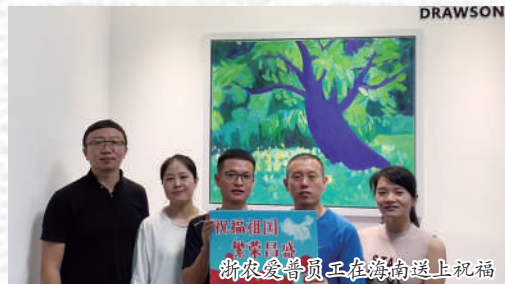
浙农金泰员工在海南送上祝福