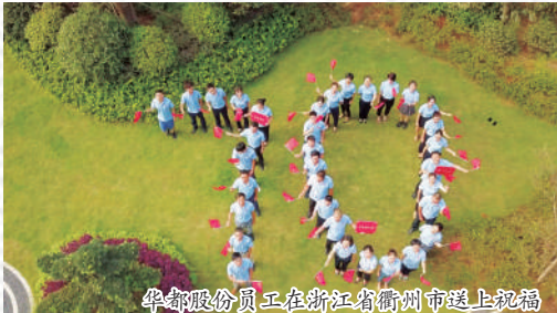
华都股份员工在浙江湖州送上祝福