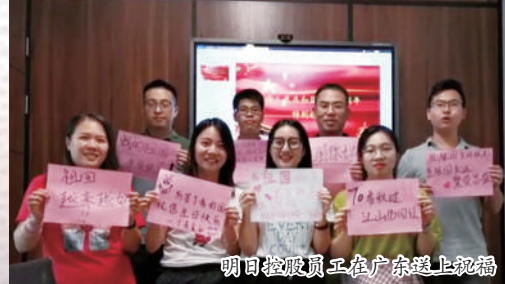
明日控股员工在广东送上祝福