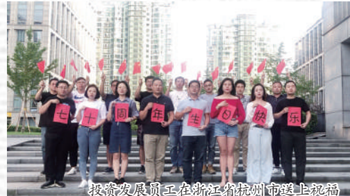
投资发展员工在浙江湖州送上祝福