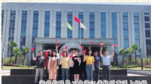
浙农控股员工在浙江湖州上市送上祝福

花团锦绣拥金秋,万里河山迎国庆。这个金秋,伟大的中华人民共和国迎来了70华诞!在浙江,从美丽的钱塘江畔杭州,到嘉兴、温州、宁波、湖州安吉、金华浦江、东阳横店,浙农员工们诉说了对祖国母亲的深情和依恋;在祖国辽阔的大地上,从江西到湖北,从海南到沈阳,从内蒙到四川,身处全国各地的浙农员工也纷纷向祖国母亲送上了他们真挚的祝福,庆祝新中国成立70周年。