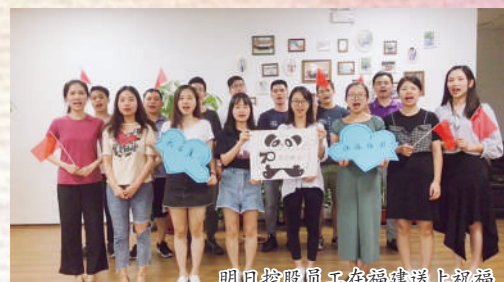
明日控股员工在福建送上祝福