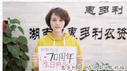
惠多利员工在湖州送上祝福