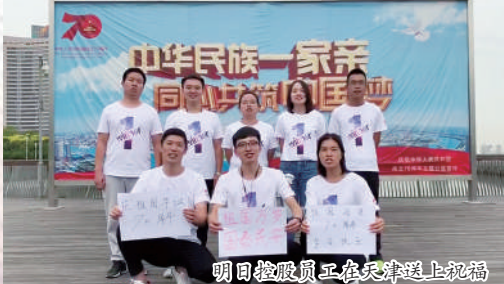
明日控股员工在天津送上祝福