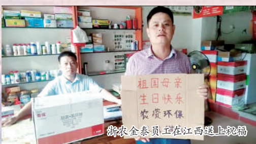
惠多利员工在江西送上祝福