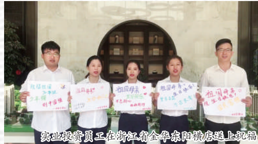
皖北控股员工在浙江省金华市送上祝福