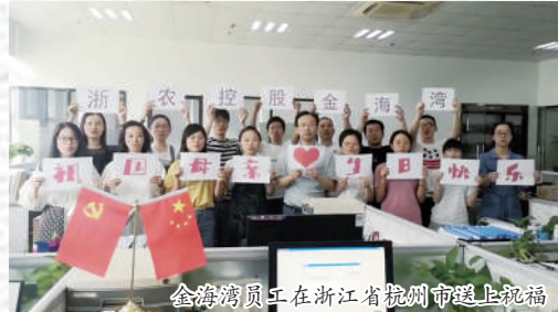
金海员工在浙江省温州市送上祝福